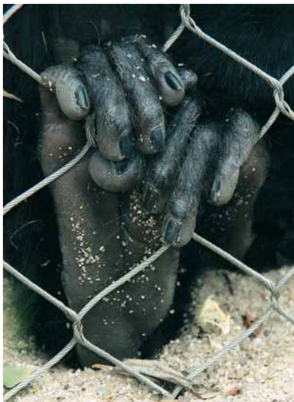
[ 3 ]