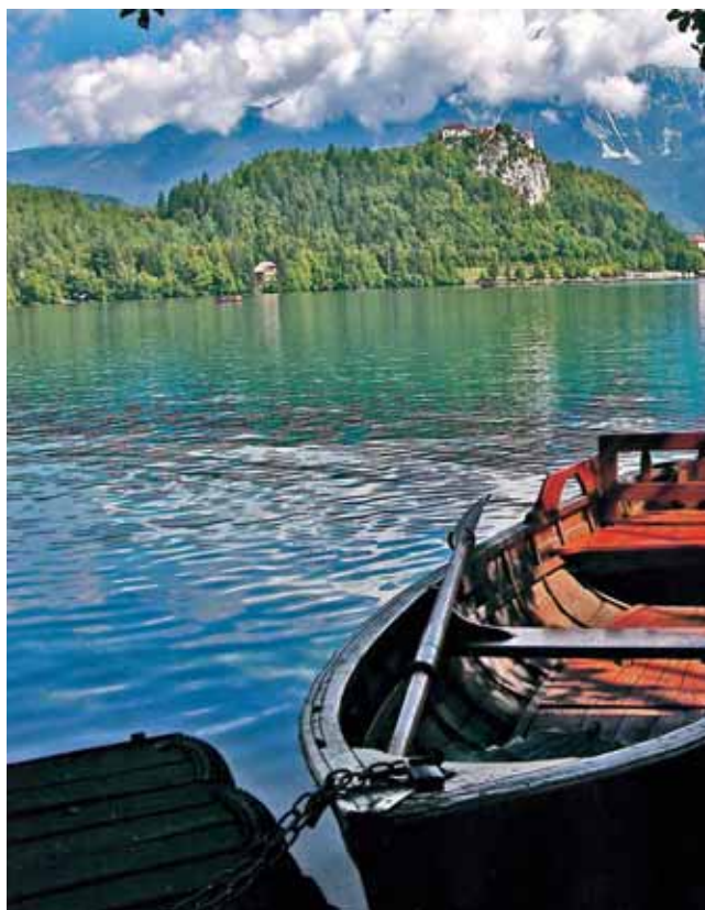
[ 1 ]