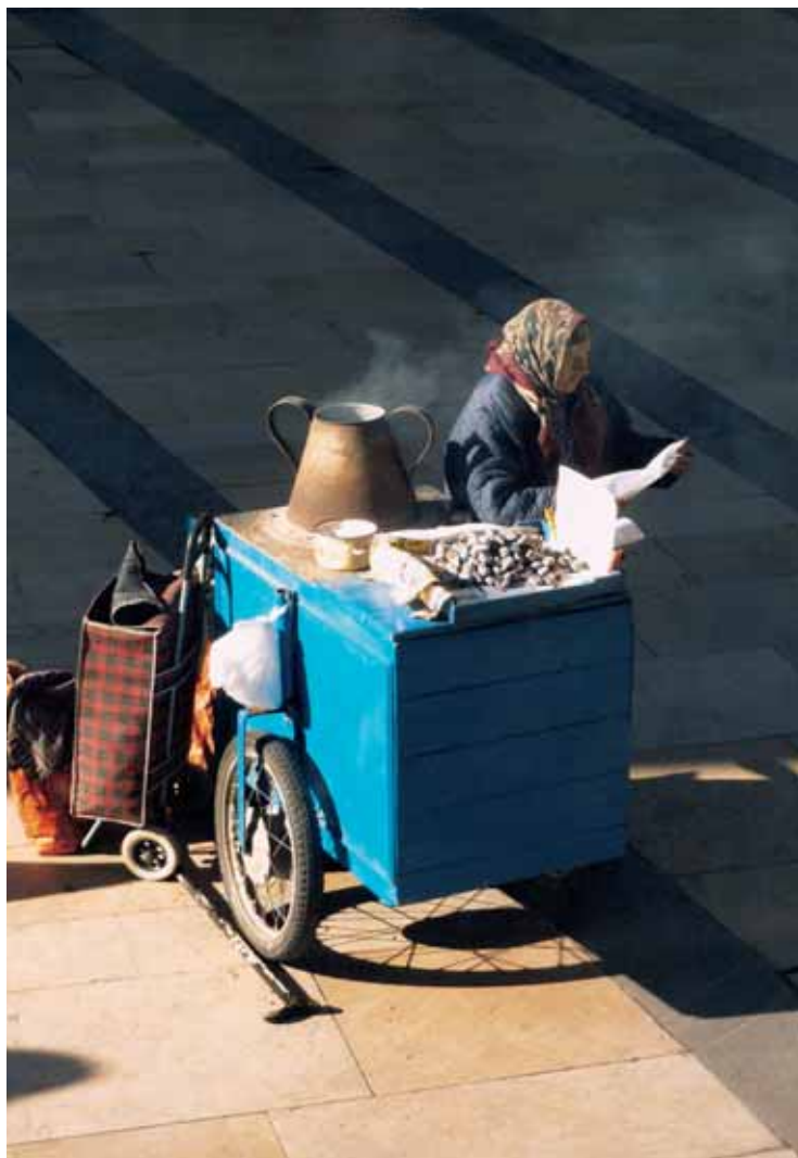
[ 2 ]