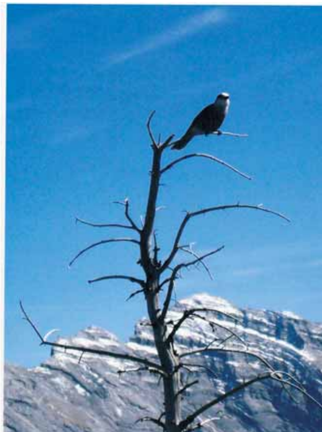
[ 1 ]

[ 3 ] Mário Bizarro, V. N. Gaia Sócio n.º 64.888