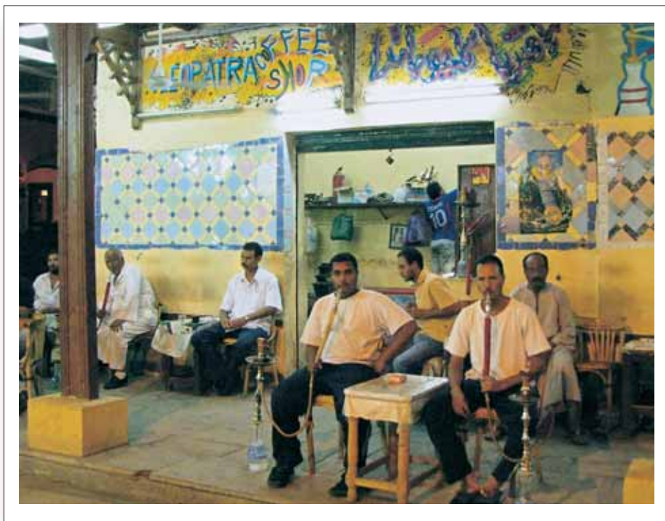
[ 2 ]