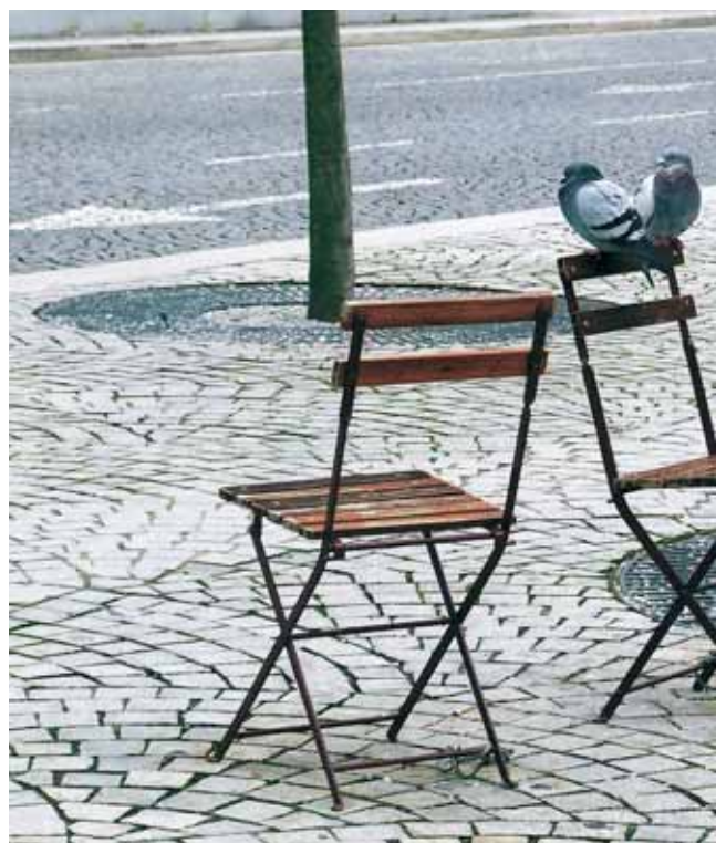
[ 3 ]