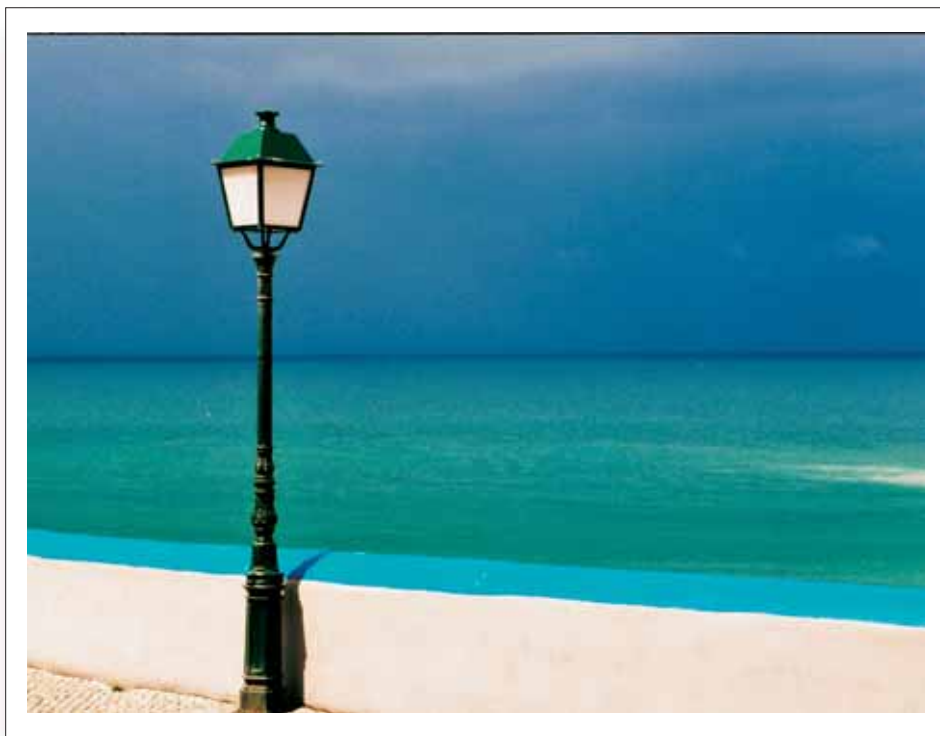
[ 1 ]