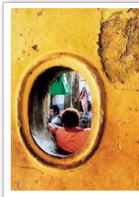
[ 2 ]