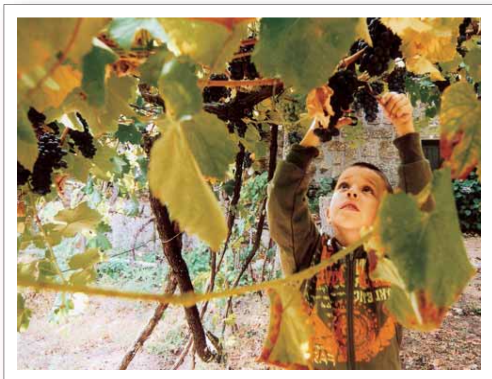
[ 3 ]